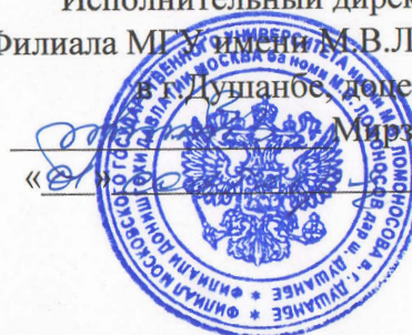
График работы руководителей

научно-исследовательских работ студентов 3 курса Филиала МГУ имени М.В.Ломоносова в городе Душанбе направления 04.03.02 «Химия, физика и механика материалов на 5 семестр 2015-16 учебного года