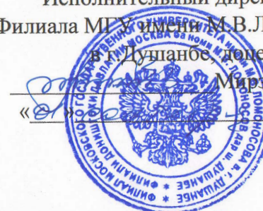
График работы руководителей

научно-исследовательских работ студентов 3 курса Филиала МГУ имени М.В.Ломоносова в городе Душанбе направления 04.03.02 «Химия, физика и механика материалов на 5 семестр 2015-16 учебного года